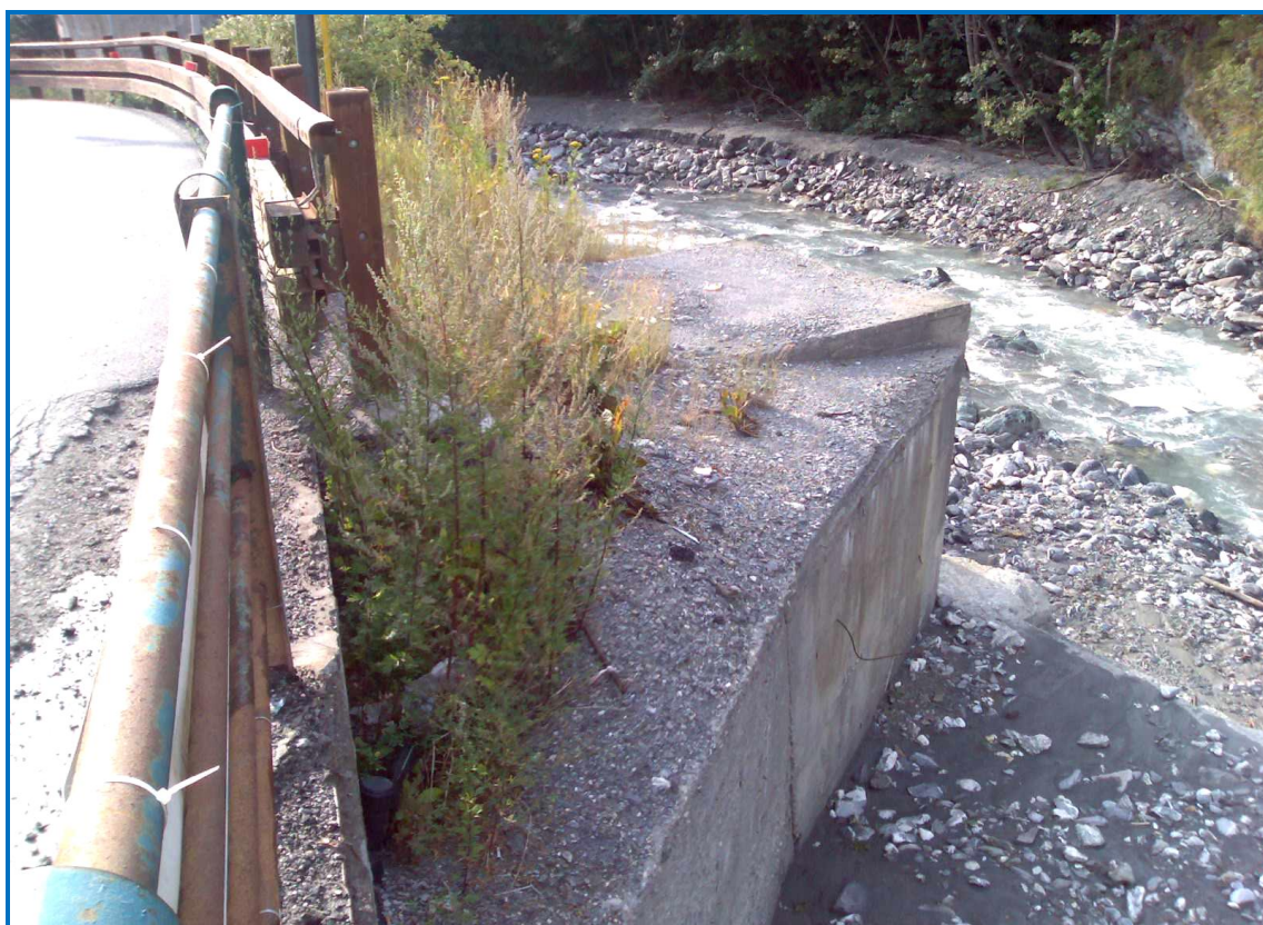
Foto 4: particolare, visto da impalcato, del pozzetto fognario esistente (spalla SX)