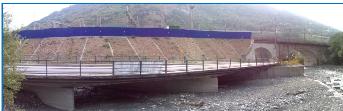
Foto 6: vista panoramica dell'impalcato esistente (spalle al centro abitato)