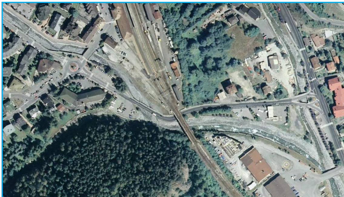
Vista aerea sulla zona di confluenza tra i Torrenti "Frejus-Melezet-Rochemolles"