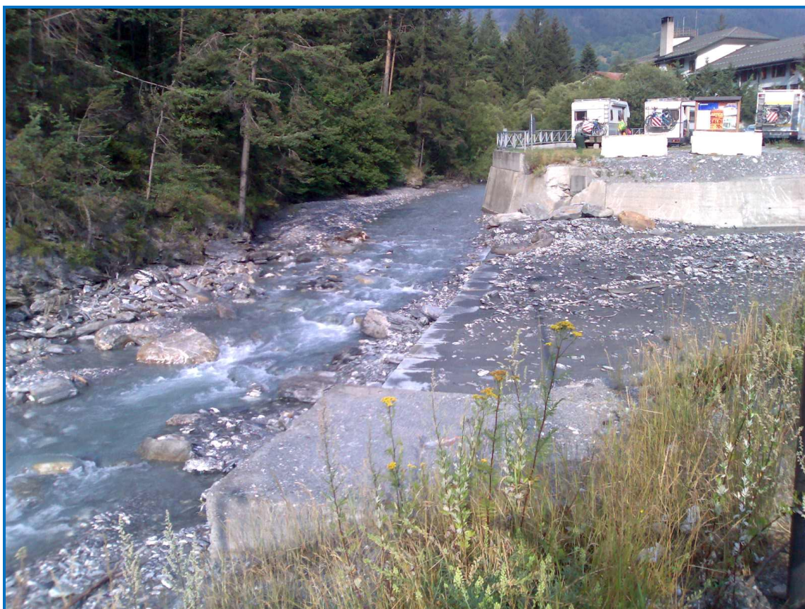
Foto 5: vista, spalle alla ferrovia, della soglia in c.a. nell'alveo del Torrente Frejus