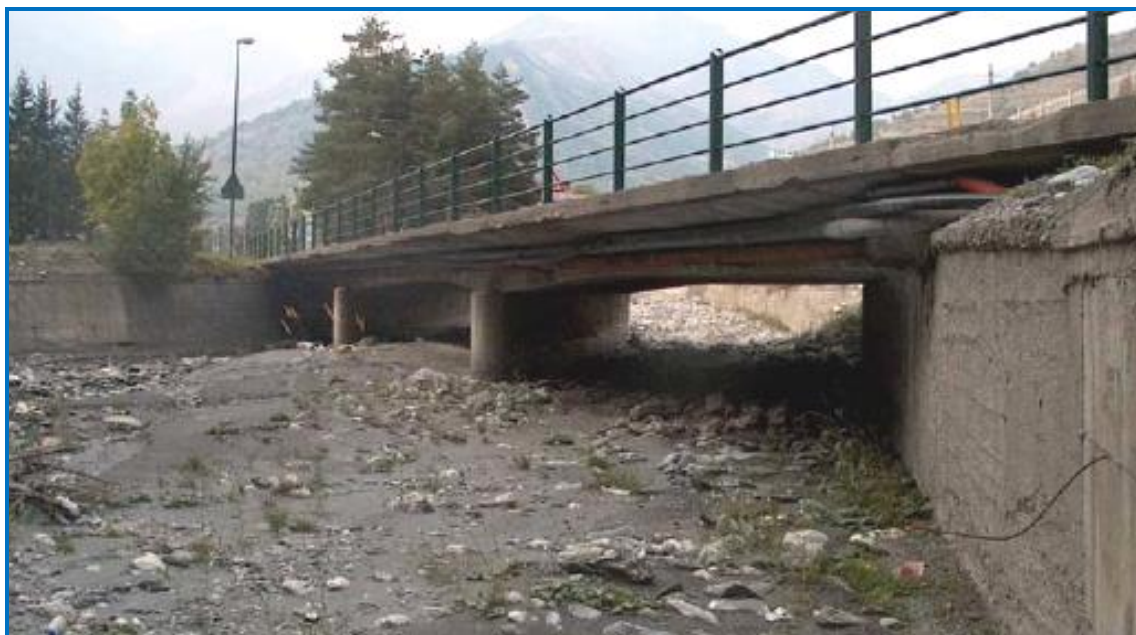
Foto 3: vista da valle dell'impalcato attuale e dell'alveo del Torrente Frejus