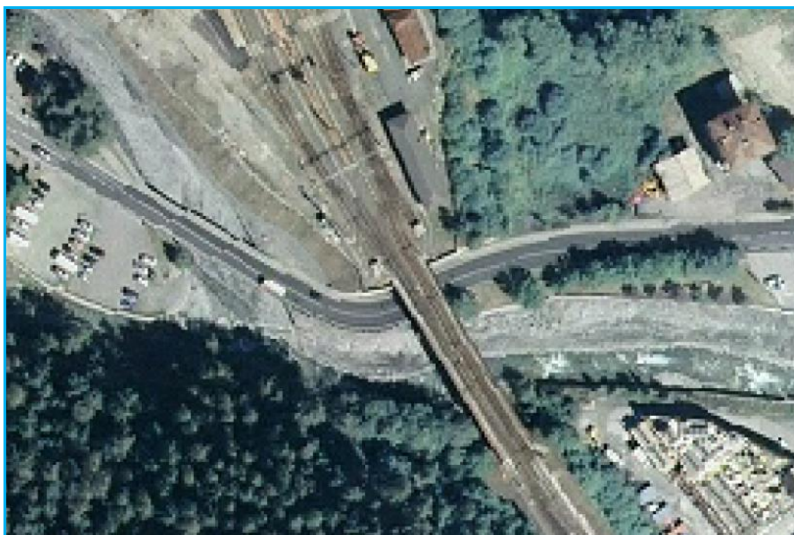
Vista aerea sull'impalcato attuale / zona di confluenza tra i Torrenti "Frejus-Melezet"