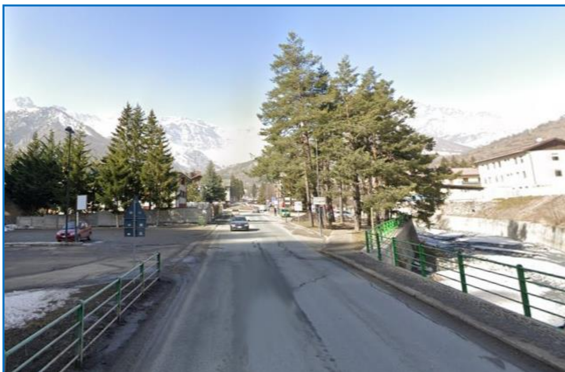
Foto 8: vista, spalle alla ferrovia, dell'attuale area verde, in DX orografica