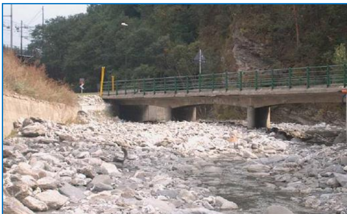
Foto 2: vista da monte dell'impalcato attuale e dell'alveo del Torrente Frejus