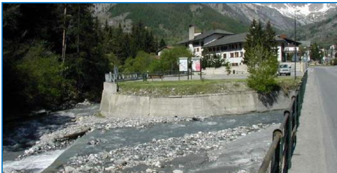
Foto 7: vista, spalle alla ferrovia, dell'attuale parcheggio, in DX orografica